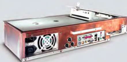
IPC-Komplettssystem für OP-Säle mit frontseitiger Schutzart IP 65