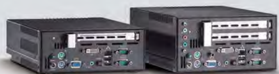
Kompaktgehäuse Power Box