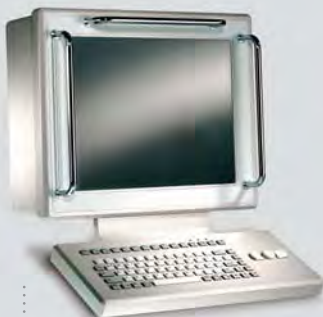
Workstation mit nach vorne klappbarer Front und spezifischen Tasten