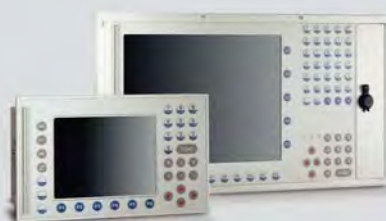
Mini-Workstation in kundenspezifischem Design