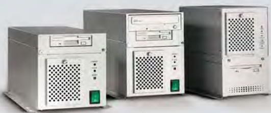
Kompaktgehäuse kurze Bauform