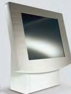
Zeiterfassungs-Terminal mit individuellem Touch Screen