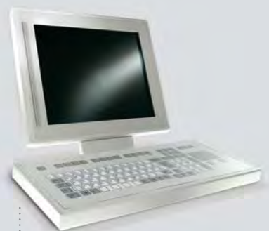
IPC-Komplettsystem mit Heat Pipe für geräuschlosen Betrieb