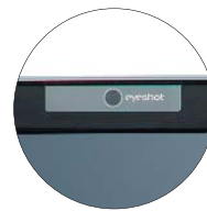
integrierte 2 Megapixel USB-Kamera