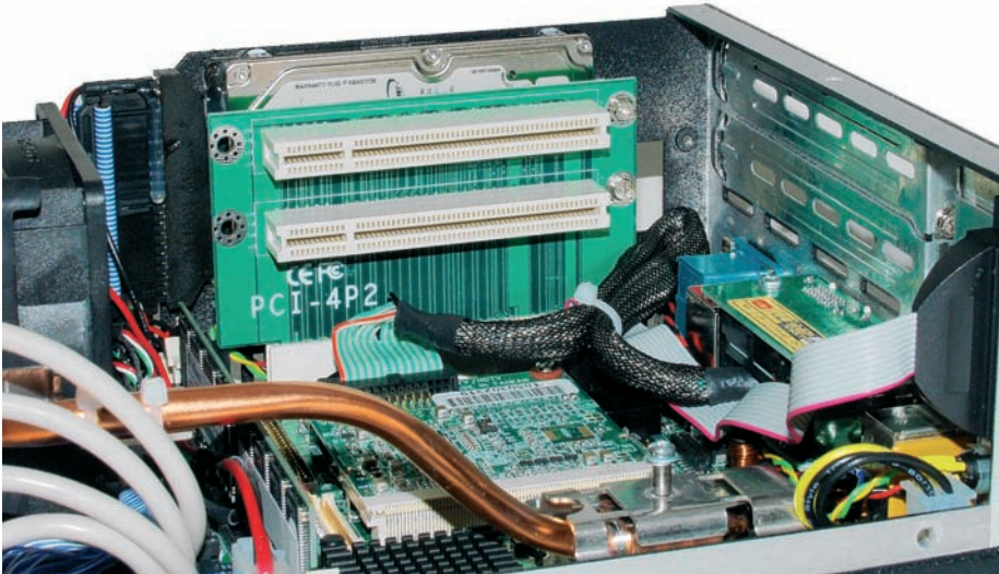
Führung und Anschlüsse der Heat-Pipe im System

schnitt eingesetzt. Dieser Lüfter läuft selbst bei hoher Luftleistung extrem leise und garantiert einen sehr geräuscharmen Betrieb. Bei Systemen mit Lüfter ist allerdings gerade dieser eine mögliche Fehlerquelle. Fällt dieser aus, steigt die Temperatur im Innern des Geräts in der Regel rapide an. Aus diesem Grunde ist die Kühlung der PowerBox redundant ausgelegt. Der Lüfter