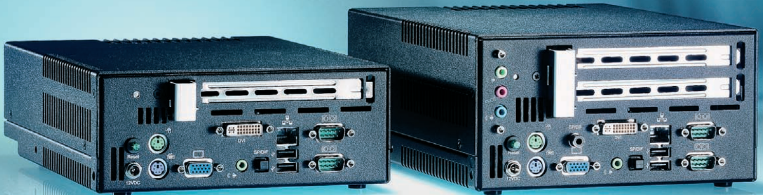
PowerBox 750 (1 PCI-Slot) und PowerBox 1000 (2 PCI-Slot)