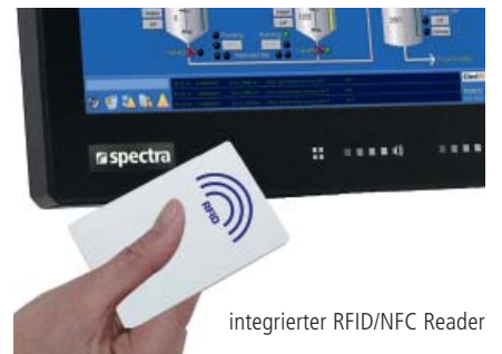
integrierter RFID/NFC Reader